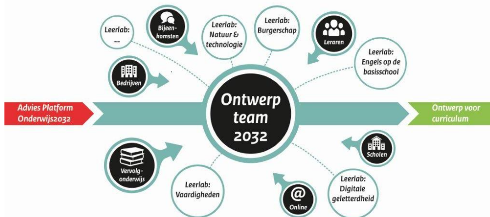
Figuur 2: Wisselwerking met Ontwerpteam2032.

adviseert over curriculumontwikkelingen. 20 Daarnaast is het streven om op termijn tot een systematiek van periodieke herijking te komen zodat het curriculum ook in de toekomst bij de tijd blijft. De vormgeving van deze systematiek en de rol van de lerarenraad daarin, baseer ik op een evaluatie van de (eerste) integrale herijking.